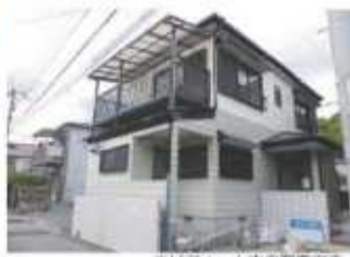
※リフォーム中の写真です。